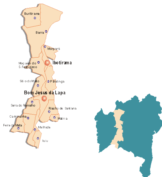
Figura 2. Mapa do Território do Velho Chico.

Embora as intervenções do Estado tenham se iniciado num período anterior, é a partir do final da década de 70 que se destaca uma maior intervenção governamental no Médio São Francisco (MSF) por meio da construção de rodovias e da implantação de projetos de irrigação. Para tanto, no início de 1972, por meio da Superintendência do Vale do São Francisco (SUVALE) foi criado o Programa de Desenvolvimento do Vale (PROVALE) - Decreto Lei nº 1.207, de 07.02.1972 - com o objetivo de modernizar e dinamizar a região. Este projeto priorizava: proteção das margens e melhoria da navegabilidade do rio São Francisco; obras de urbanização, infraestrutura social e de saneamento; implantação de projetos de reflorestamento e de irrigação; criação de parques nacionais e construção de rodovias. A construção das três pontes sobre o rio São Francisco, em Juazeiro, Ibotirama e Bom Jesus da Lapa, foi outro importante traço de desenvolvimento, uma vez que permitiu a conexão com Salvador e Brasília.