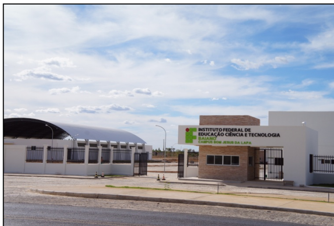
Figura 4. Vista frontal do IF Baiano campus Bom Jesus da Lapa.

O Campus Bom Jesus da Lapa localiza-se à margem esquerda da BR 349, distante 14 km do centro da Cidade de Bom Jesus da Lapa. Foi criado através da lei 11.892 de 2008, visando atender às demandas dos municípios localizados na região do Médio São Francisco, através da formação de mão de obra qualificada para atuar em diversos setores da sociedade.