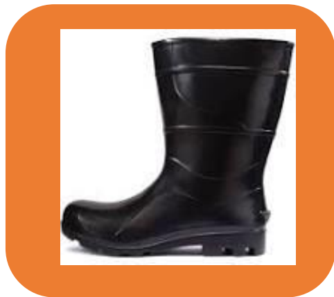
Uso de botas