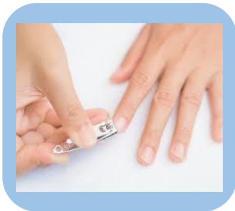
Unhas cortadas e sem esmaltes