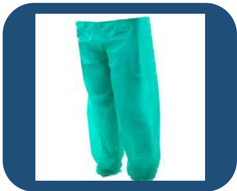
Uso de calças compridas