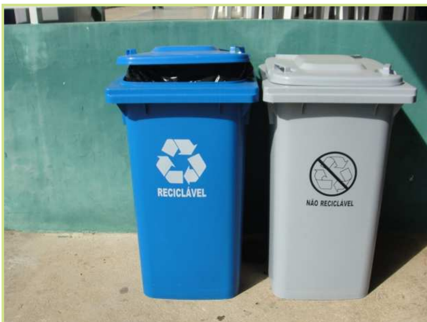
Figuras 4 e 5 - Lixeiras para coleta seletiva de lixo, distribuídas pelo Campus.

Em janeiro de 2016 as ações voltadas para a implementação do programa de coleta seletiva no Campus do IFBAIANO de G. Mangabeira, foram iniciadas com a instalação das lixeiras de coleta seletiva em todas as salas e áreas externas do Campus, além da distribuição de panfletos e cartazes para sensibilização da comunidade.