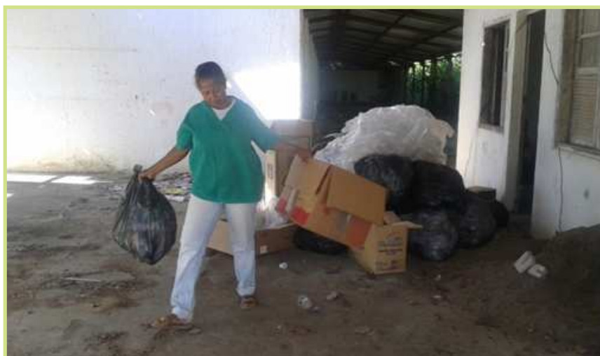
Figuras 8 e 9 - Membros da Associação Cata Renda Ambiental recolhendo o lixo reciclável no Campus do IFBAIANO de Governador Mangabeira.

Entre março e abril de 2016 todos os docentes envolvidos no Projeto desenvolveram uma Oficina Interdisciplinar sobre Educação Ambiental, com os estudantes do curso Técnico em Agroindústria, que ingressaram no semestre 2016.1, no Campus do IFBAIANO de G. Mangabeira. A carga horária total da oficina foi de 42h e ela teve como objetivo geral provocar nos alunos a percepção de que a questão ambiental é resultado da forma como a sociedade interage com o meio.