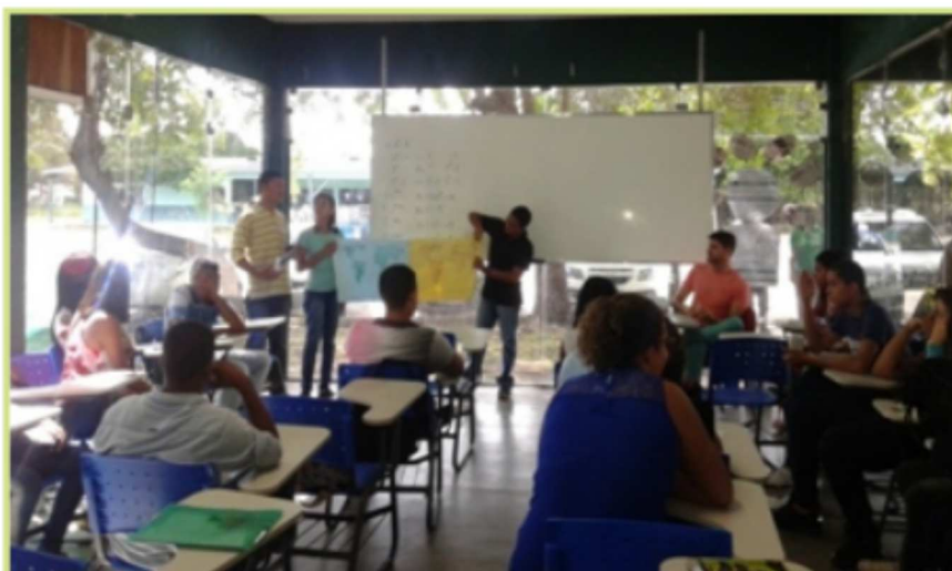
Figuras 10 e 11 - Atividades desenvolvidas, com a turma do curso Técnico em Agroindústria, durante a oficina interdisciplinar sobre Educação Ambiental.