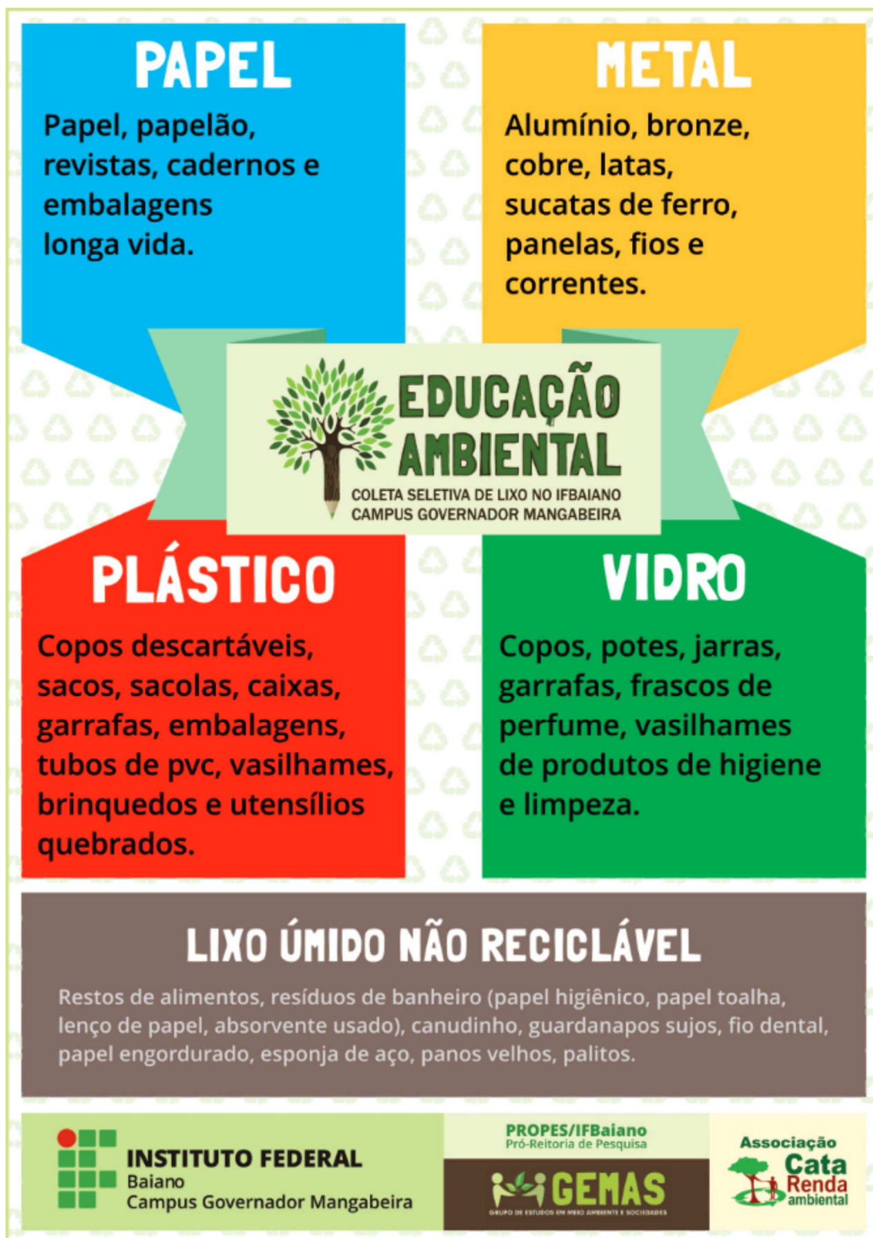
Figura 7 - Cartaz sobre os tipos de lixo distribuído por todo o Campus.