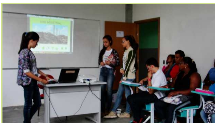
Figura 12 - Ações de sensibilização realizadas nas salas de aula.

As ações de sensibilização com a comunidade do Campus foi desenvolvida entre novembro de 2015 e maio de 2016, e entre elas é possível destacar: utilização de questionários para o diagnóstico sobre o status do conhecimento de estudantes e servidores do IF Baiano Campus G. Mangabeira sobre a problemática do lixo; desenvolvimento de atividades com os estudantes do Campus, a fim de passar informações sobre os tipos de lixo e importância da coleta seletiva e reciclagem.