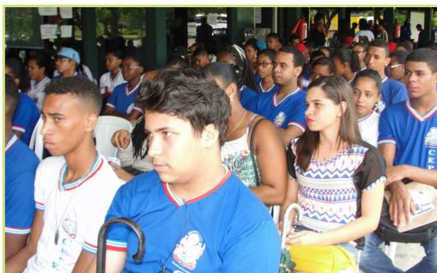
Figuras 3 - Estudantes externos convidados a participar da exibição de filmes.

O objetivo dessa Mostra foi divulgar e estimular atividades de educação ambiental, participação e mobilização social por meio da produção independente audiovisual, bem como atender a demanda de espaços educadores por materiais pedagógicos multimídias. Em 2015 o Campus do IFBaiano de Governador Mangabeira foi um espaço exibidor dos filmes: Dias melhores; Gerar lixo com luxo ou gerar luxo com lixo?; Há vida após o lixão? Lixo uma questão de consciência, todos foram produzidos por estudantes de todo o Brasil.