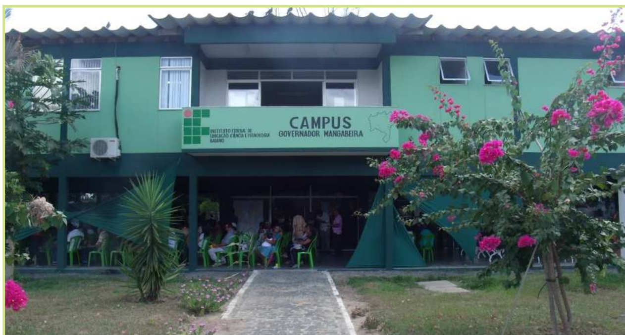
Figura 1 - IFBaiano Campus Governador Mangabeira.

O INSTITUTO FEDERAL DE EDUCAÇÃO, CIÊNCIA E TECNOLOGIA BAIANO, CAMPUS GOVERNADOR MANGABEIRA foi criado em 1 de agosto de 2011 e está localizado na Região do Recôncavo Sul da Bahia, a 119Km da capital do Estado. O município possui área territorial de 94,359 km² e sua população é de 19.828 habitantes (IBGE, 2010) e ocupa a posição de 47.º lugar no ranking do Índice de Desenvolvimento Humano (IDH) do Estado. O Campus está inserido em um bairro periférico, bastante carente, que enfrenta muitos problemas a exemplo da falta de segurança pública, assistência médica e infraestrutura. Neste último item é possível destacar a questão do lixo na cidade, que é descartado de forma inadequada e não existe coleta seletiva.