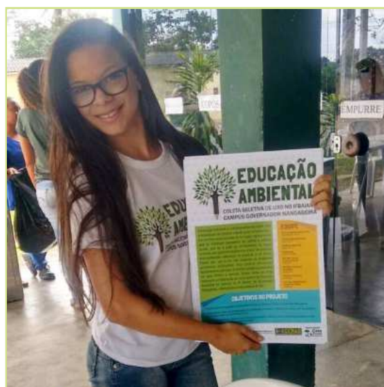
Figura 6 - Monitora demonstrando um dos cartazes que forma distribuídos no Campus.