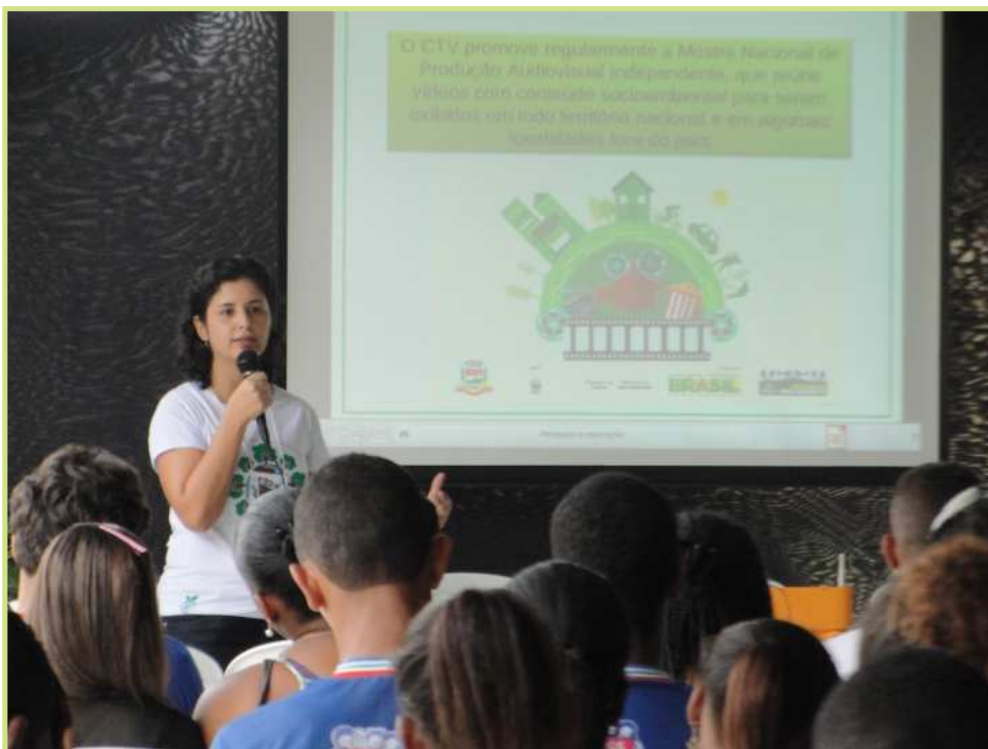
Figuras 2 - Exibição de filmes sobre a temática do Lixo no IFBaiano Campus Governador Mangabeira.

O objetivo dessa Mostra foi divulgar e estimular atividades de educação ambiental, participação e mobilização social por meio da produção independente audiovisual, bem como atender a demanda de espaços educadores por materiais pedagógicos multimídias. Em 2015 o Campus do IFBaiano de Governador Mangabeira foi um espaço exibidor dos filmes: Dias melhores; Gerar lixo com luxo ou gerar luxo com lixo?; Há vida após o lixão? Lixo uma questão de consciência, todos foram produzidos por estudantes de todo o Brasil.