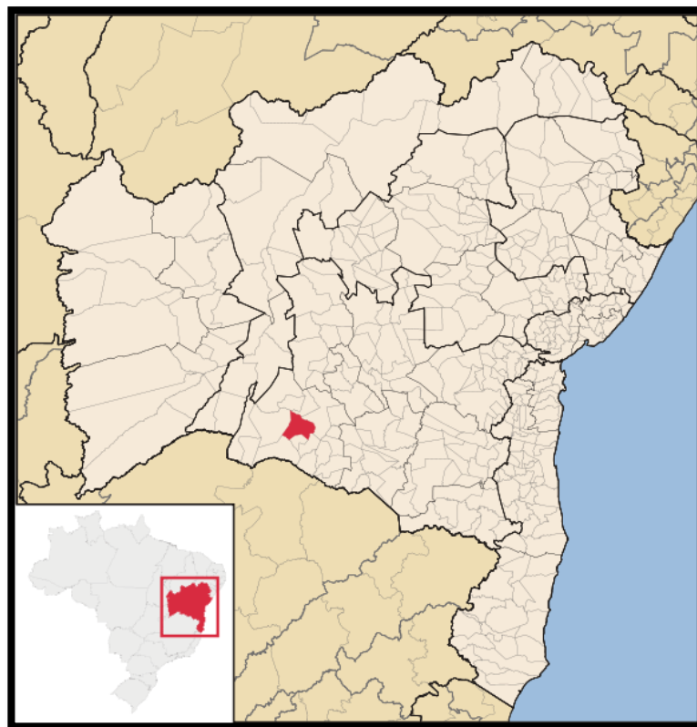
Figura 2 - Localização do município de Guanambi

O Instituto Federal de Educação, Ciência e Tecnologia – IF Baiano – campus Guanambi vem complementar o sistema educacional do município, oferecendo educação profissional, tecnológica e superior abrangendo também os municípios vizinhos.