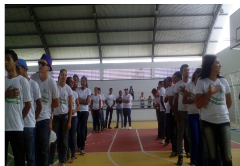
Momentos do IF Solidário