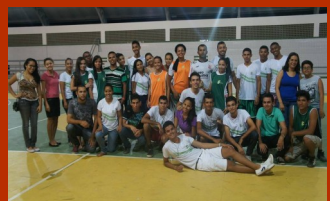
RecortesSemana de Integração

A Semana de Integração 2015 teve início com a aula inaugural, realizada no dia 02 de março no Auditório do Campus. Com uma programação que contemplou composição de mesa solene, pronunciamento da equipe gestora, atividades artístico e culturais e palestras, a comunidade estudantil recém ingressa, pode conhecer um pouco do trabalho da instituição, o perfil de cada curso, a função de cada coordenação ligada à Diretoria