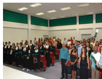
Público na Formatura

cados, mas sobretudo humanizados, aptos a atuarem profissionalmente na construção de uma sociedade mais justa e igualitária.