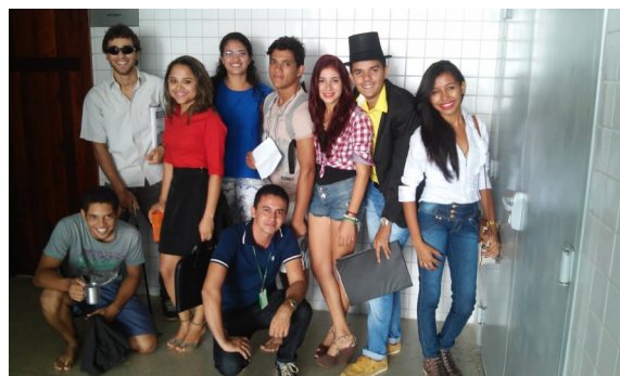
Elenco da Peça

Oportunamente, será lançado um Edital Específico para a seleção de estudantes interessados em ingressar no referido Grupo de Teatro.