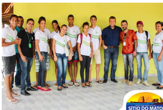
Visita à Pref. de Sítio do Mato

Em 2015, o Campus ampliou as parcerias para a oferta do Transporte Escolar aos Estudantes. Em visita realizada às Prefeitura de Serra do Ramalho e Sítio do Mato, a CAE juntamente com a Coordenação do Curso de Agricultura e Diretoria Acadêmica apresentaram aos gestores as demandas do Campus e acordaram a disponibilização de veículos em turnos e trechos até então não ofertados, como é o caso de Sítio do Mato (turno matutino) e Serra do Ramalho (Turno Vespertino).