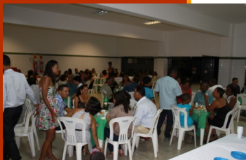
Momentos da Formatura

No dia 03 de dezembro de 2014, foi realizado o Cerimonial de Formatura de 15 estudantes do Curso Técnico em Informática Subsequente, remanescentes de turmas de 2010, 2011 e 2012.