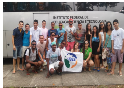
Delegação do IF Baiano

Comitiva de estudantes do Campus Bom Jesus da Lapa integrou a Delegação do IF Baiano que participou da Bienal de Arte e Cultura da UNE, ocorrida no Rio de Janeiro no Período de 01 a 06 de fevereiro de 2015. Ao todo, trinta e três estudantes do IF Baiano participaram do evento, que contou com a realização de oficinas temáticas, mostras visuais, espetáculos teatrais e musicais. Em programação paralela, os estudantes participaram também do Encontro Nacional de Escolas Técnicas (ENET) que neste ano discutiu o fortalecimento das Políticas de Assistência Estudantil.