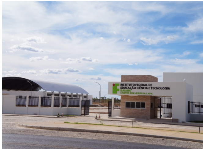
Figura 4: Vista Frontal do Campus Bom Jesus da Lapa.

O Campus Bom Jesus da Lapa dispõe de uma infraestrutura singular, composta de laboratórios de diversas áreas, biblioteca, auditório, ginásio de esportes, refeitório, bloco administrativo e amplo conjunto de salas de aula, totalizando uma área construída superior a 4.257,26 m 2 . A estrutura e o potencial que o Campus Bom Jesus da Lapa possui têm sido reconhecidos regionalmente e gerado grandes anseios e expectativas na população, que carece de oportunidades educacionais e formativas.