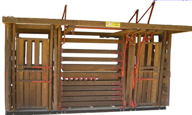
VISTA DO MODELO DE BRETE COM BALANÇA

BR 349 - Km 14 – Zona Rural - Caixa Postal 34 - CEP: 47600.000 - Bom Jesus da Lapa – BA E-mail: gabinete@lapa.ifbaiano.edu.br