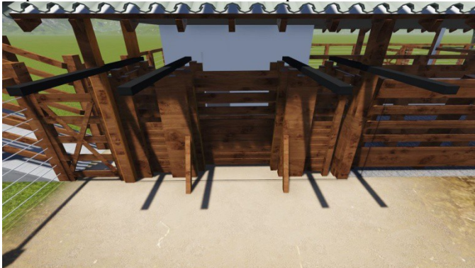
VISTA DO BRETE COM BALANÇA

Dimensionado para se trabalhar com no máximo oito animais por vez. Deverá ter 10,40m de comprimento, em formato trapezoidal sendo 40cm na base e 1,00m no topo. Deverá conter plataforma de trabalho com altura de 60cm na área coberta e salva vidas na parte externa com vão de 80cm. Os mourões serão de 20x20cm com 3,50m de altura. As tabuas da base deverão ser superpostas para que as patas dos animais não se enrosquem.