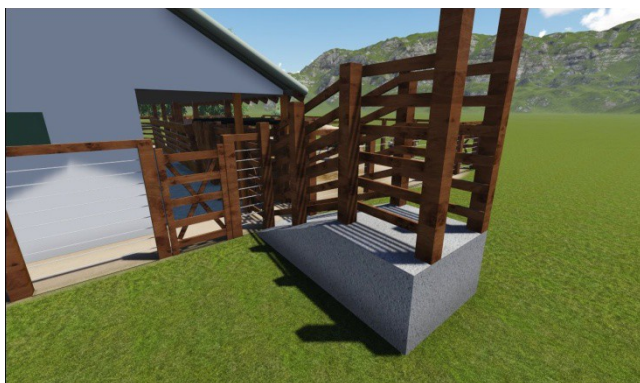
VISTA LATERAL EMBARCADOURO

Rampado com 3,20m comprimento e 1,10m altura será confeccionada em alvenaria de pedra argamassada e piso em concreto áspero com frisos de 4cm de profundidade a cada 15cm no sentido transversal. Deverá ter fechamento lateral com tábuas de madeira de lei serrada 4x15cm com espaçamento de 20 cm entre réguas até o topo do mourão.