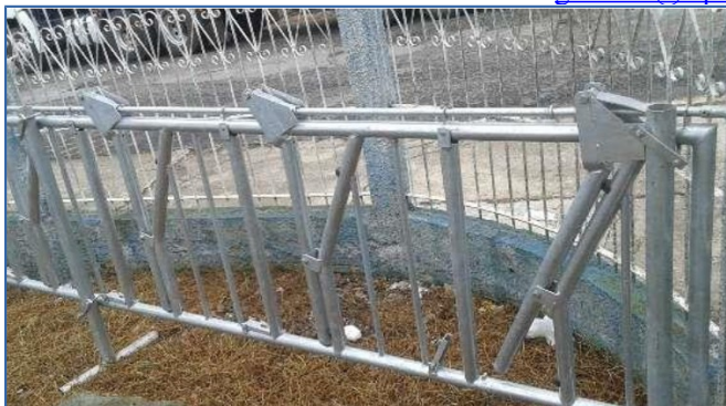
VISTA MODELO DE CANZIL MECÂNICO

BR 349 - Km 14 – Zona Rural - Caixa Postal 34 - CEP: 47600.000 - Bom Jesus da Lapa – BA E-mail: gabinete@lapa.ifbaiano.edu.br