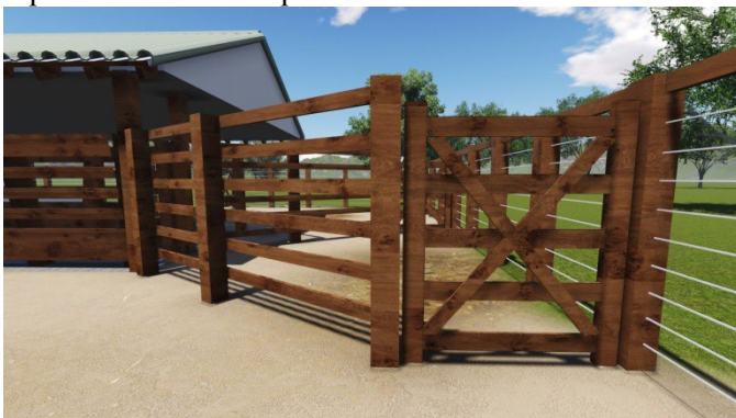
VISTA LATERAL SERINGA

Será em tábuas de madeira de lei aparelhadas 4x15cm com espaçamento de 20 cm entre régua, até o topo dos mourões. O piso será em cascalho.