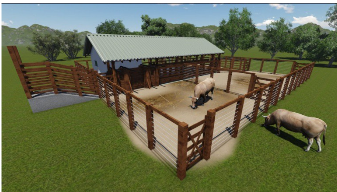
PESPECTIVA DO CURRAL