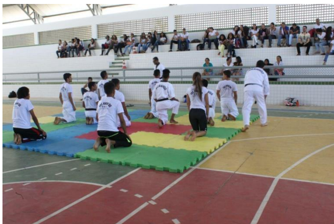
Figura 1: Aula de Taekwondo na Quadra poliesportiva do IF Baiano Campus Lapa.