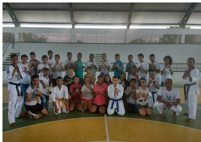
Figura 2: Praticantes de Taekwondo do Campus Lapa