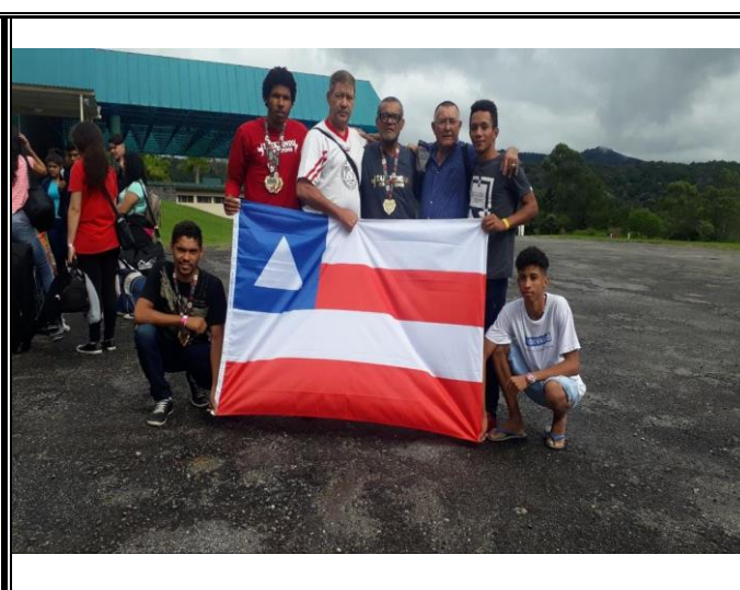
Figura 7: Alunos e professores de taekwondo com a bandeira da Bahia