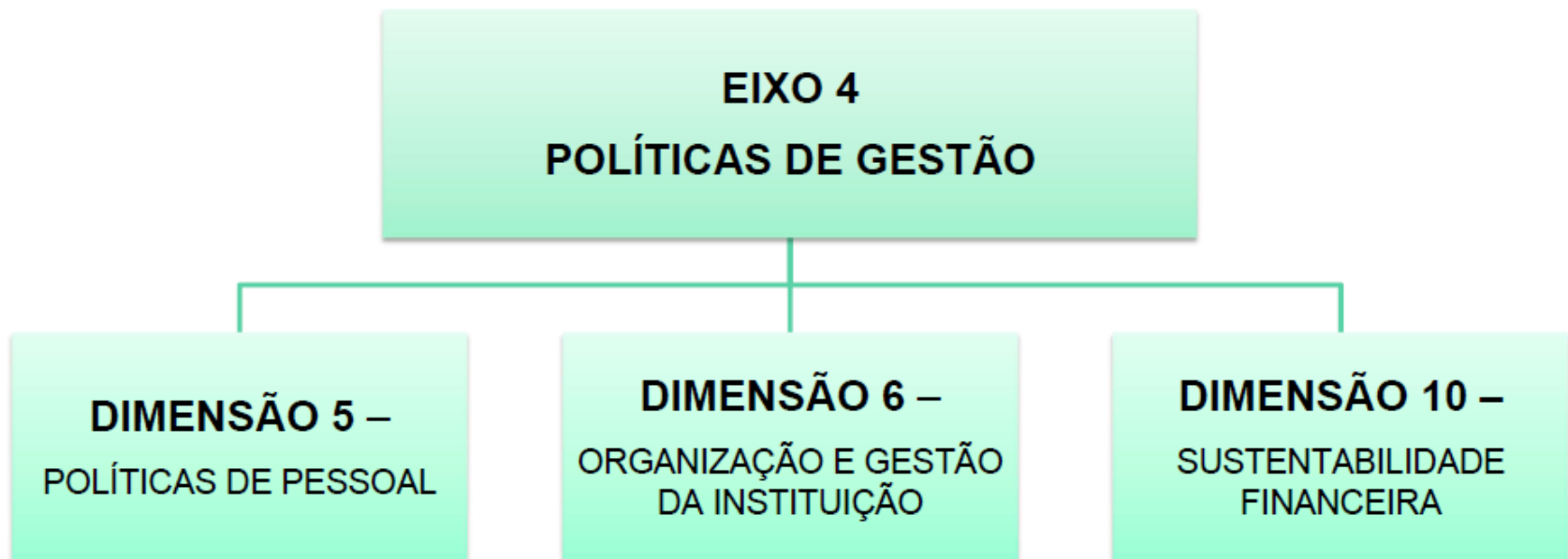
FIGURA 2 - Fluxograma das dimensões consideradas no Eixo 4