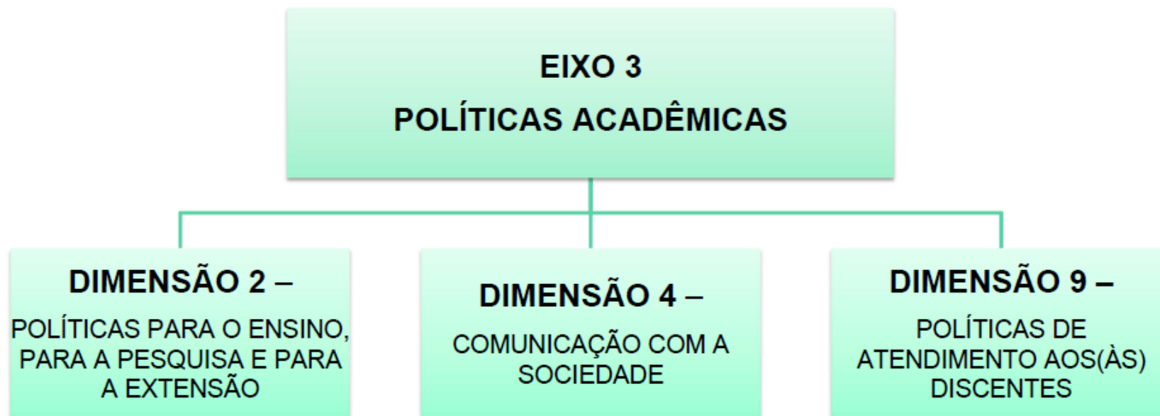
FIGURA 1 - Fluxograma das dimensões consideradas no Eixo 3