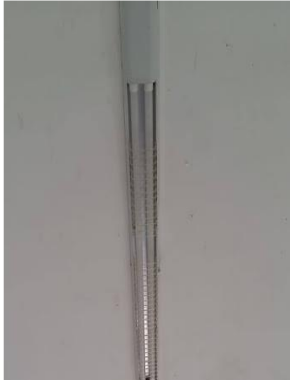
Serviço de manutenção da instalação elétrica na área da caprinocultura;