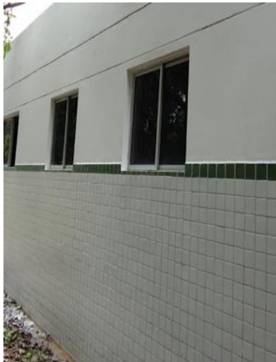
Manutenção na cobertura da área dos animais;