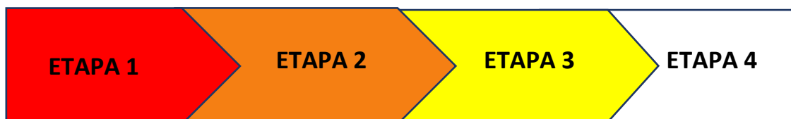
Figura 01 – Etapas de execução do Plano de Contingência para o Campus Bom Jesus da Lapa.

Para efeito de execução, o Plano de Contingência Local do Campus Bom Jesus da Lapa será fragmentado em quatro etapas, a saber: Circulação Restrita (Etapa 1); Circulação Monitorada – Nível I (Etapa 2); Circulação Monitorada – Nível II (Etapa 3); Circulação Livre (Etapa 4), em sequência, conforme disposição na Figura 01.