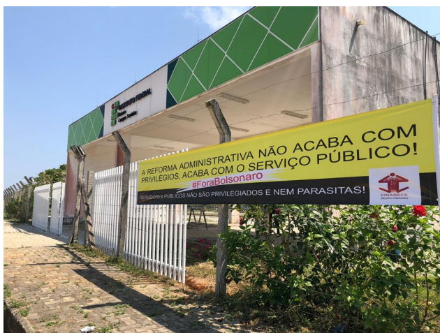
Faixa colocada na entrada do Campus

SERVIDORES PÚBLICOS NÃO SÃO PRIVILEGIADOS E NEM PARASITAS!