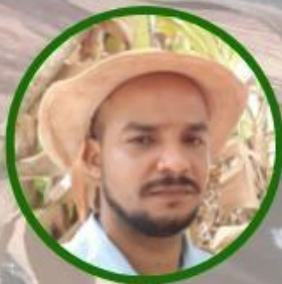
Erasto Gama IF Baiano Campus Serrinha. Nea Abelmanto