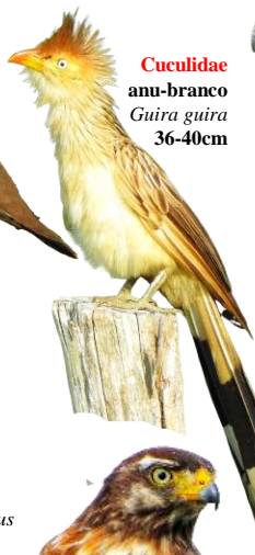
Cuculidae anu-branco Guira guira 36-40cm