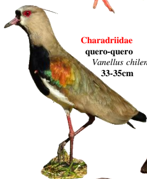
Charadriidae quero-quero Vanellus chilensis 33-35cm