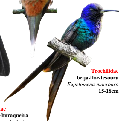
Trochilidae beija-flor-tesoura Eupetomena macroura 15-18cm