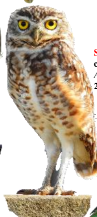
Strigidae coruja-buraqueira Athene cunicularia 23cm