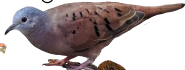
Columbidae rolinha-roxa Columbina talpacoti 17cm