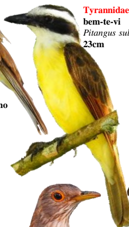
Tyrannidae bem-te-vi Pitangus sulphuratus 23cm