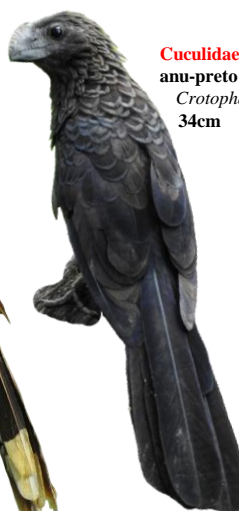
Cuculidae anu-preto Crotophaga ani 34cm