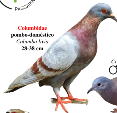
Columbidae pombo-doméstico Columba livia 28-38 cm