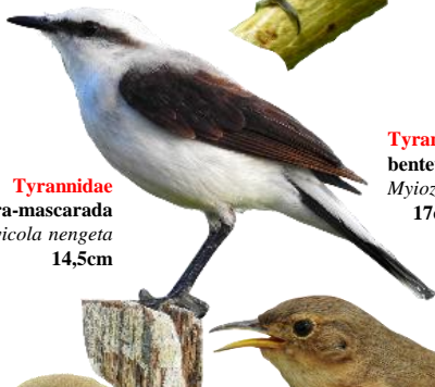
Tyrannidae lavadeira-mascarada Fluvicola nengeta 14,5cm