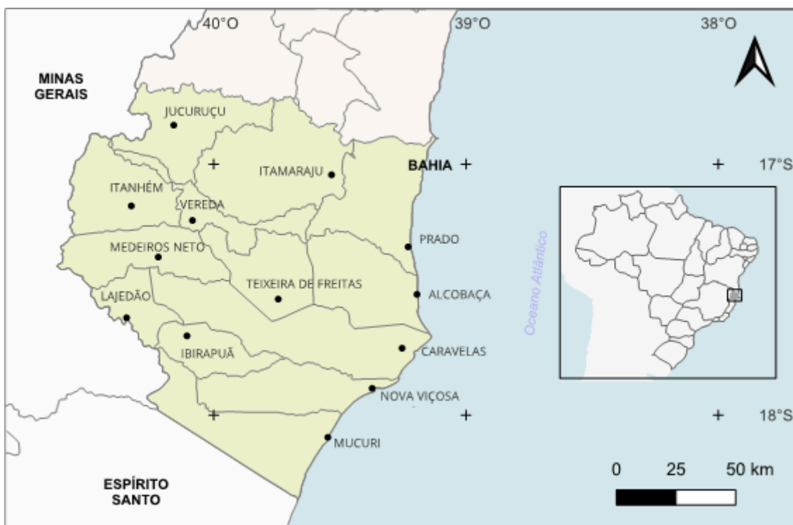
Figura 1 - Mapa do Território Extremo Sul da Bahia com seus municípios

O IF Baiano Campus Teixeira de Freitas está situado em Teixeira de Freitas, município que centraliza os demais componentes do Território de Identidade do Extremo Sul da Bahia: Alcobaça, Caravelas, Ibirapuã, Itamaraju, Itanhém, Jucuruçu, Lajedão, Medeiros Neto, Mucuri, Nova Viçosa, Prado e Vereda – conforme a Figura 1 (Superintendência de Estudos Econômicos e Sociais da Bahia, 2015).