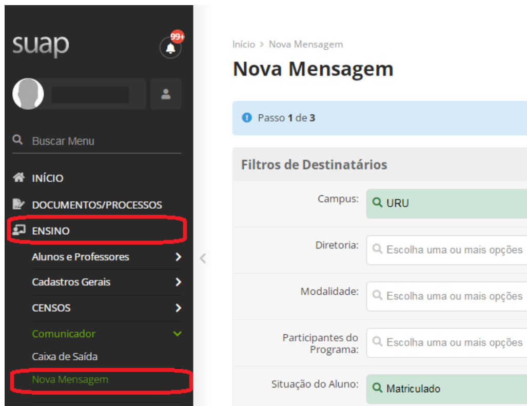
Figura 1: Imagem de acesso ao Comunicador a partir do Menu Principal